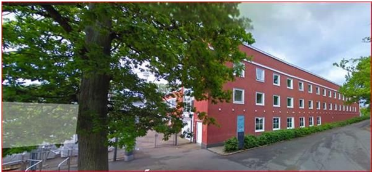
Til Ceres Arena